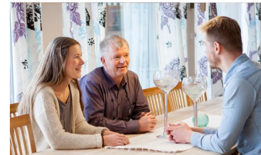
Velkommen til oss!